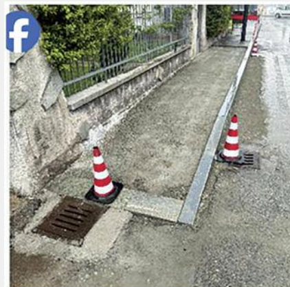
PEBA lungo la ciclabile in v. Cavour

Infatti il cantiere della Villa Govean mostra la struttura di un vano ascensore a integrazione dell'edificio storico, mentre quello della ciclabile mostra il rifacimento dei tratti di marciapiede ammalorati e la messa a norma con la sostituzione dei gradini con rampe per carrozzine. Su FB la nostra Consulta Disabilità ha apprezzato l'intervento: "Piccoli passi per una Alignano a misura di tutti".