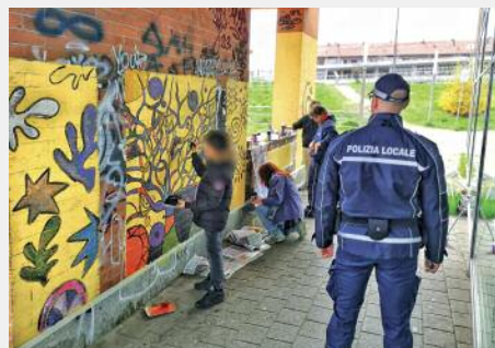
Dipingendo il "Muro della metamorfosi" al movicentro

dagli agenti della nostra Polizia Locale in collaborazione con il Nucleo di Prossimità del corpo di Polizia Locale della Città di Torino e con le nostre scuole e associazioni. È consistito nel coinvolgimento attivo di minorenni in progetti come quello dei murali del "muro della metamorfosi" al movicentro, dipinti dagli stessi ragazzini che precedentemente l'avevano vandalizzato. I problemi sono enormi ma almeno qualche risultato si vede!