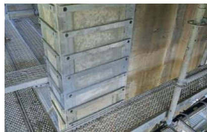
Rafforzamento dei pilastri portanti