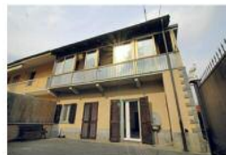
Interessante soluzione semi indipendente con cortile e box.