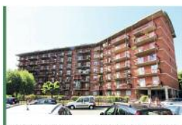
Complesso Mazzini appartamento di 80 mq con terrazzo e box.

Tempocasa Alpignano | 011 19864764 alpignano@tempocasa.it | Piazza Vittorio, 3 www.tempocasaalpignano.it