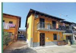
Soluzione bifamiliare con finiture di pregio in centro paese.