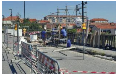
Lavori di messa in sicurezza del parapetto

Sul Ponte Vecchio il transito avverrà a senso unico da