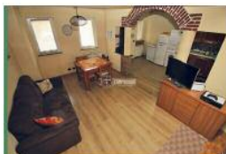
Alpignano centro porzione di casa su 2 livelli com e investimento.