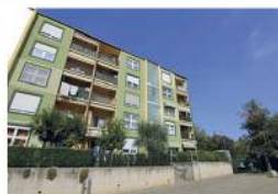
Alpignano Belvedere, appartamento di 68 mq con terrazzino.