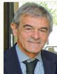
Sergio Chiamparino Presidente della Regione Piemonte