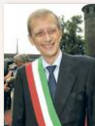
Piero Fassino Sindaco della Città Metropolitana di Torino

al XIX. È un'importante operazione di difesa della cultura locale, che consente di valorizzare località come Alpignano, in cui particolarmente viva e forte è la memoria del passato. Gli organizzatori delle rievocazioni hanno saputo abbinare momenti di cultura e meditazione a momenti di gioia e di svago, ambientazioni suggestive e conviviali legate alla riscoperta di antichi sapori e antiche ricette. A loro va il nostro plauso ed il nostro costante incoraggiamento.