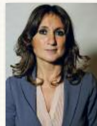
Barbara Cervetti Consigliera metropolitana delegata alla cultura e al turismo